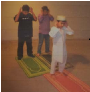
Digunakan untuk solat