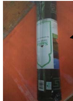
Ia boleh digulung dan disandang