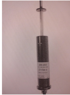
Gambar 1 : Sachs Shock Absorber for Commercial Vehicles

Barangan merupakan sebuah Penyerap Hentakan / Shock Absorber jenis tekanan gas / gas pressure untuk kegunaan kenderaan komersial membawa barangan. Barangan ini dikenali dengan nama perdagangannya sebagai Shock Absorber , jenama Sachs .