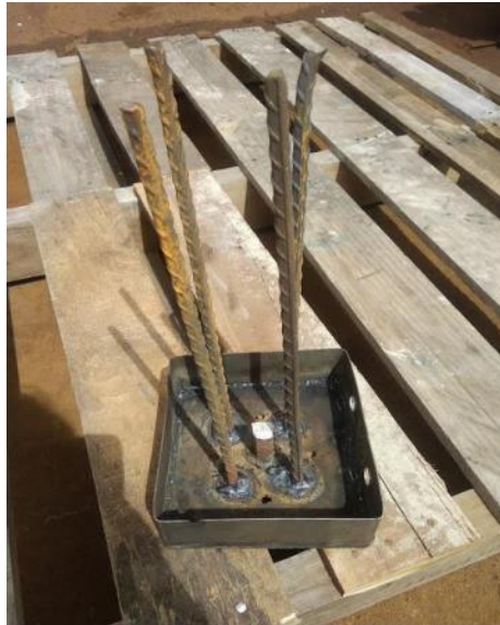
Gambar rajah 2: Contoh barangan