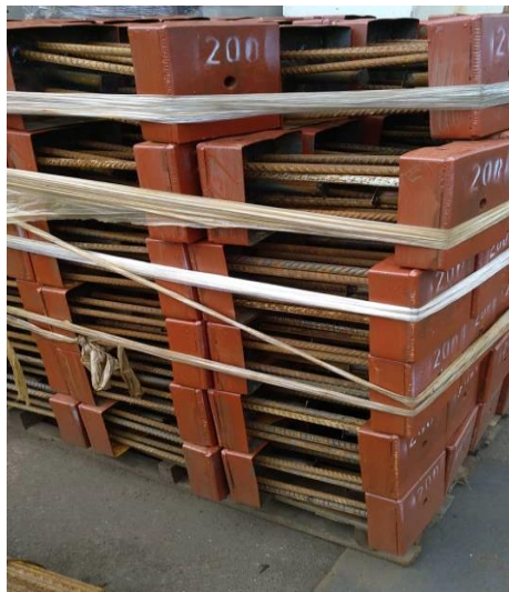
Gambar rajah 3: Bentuk barangan semasa dijual